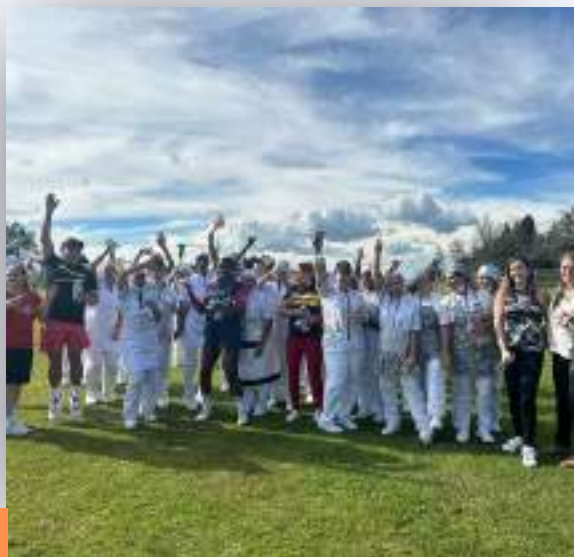
Personal Serviexpress - Thanksgivin Cup

Evento de clausura de Thanksgiving, liderado por mamás del Colegio en beneficio del staff de servicios generales, Tech, Serviexpress y vigilancia.