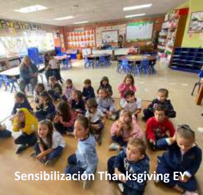
Sensibilización Thanksgiving EY