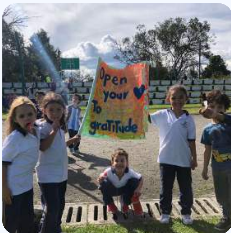
Evento de clausura Thanksgiving