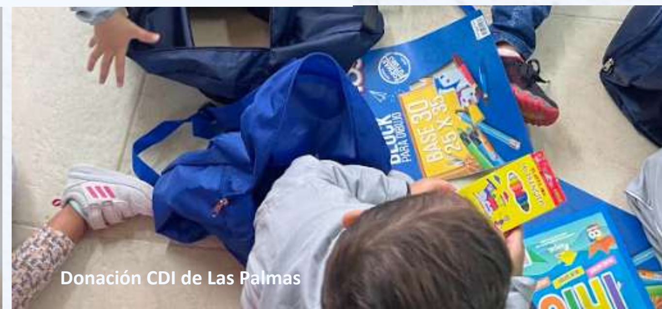
Donación CDI de Las Palmas