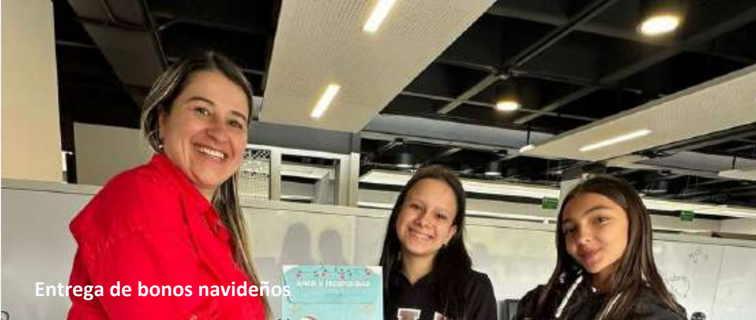
Entrega de bonos navideños