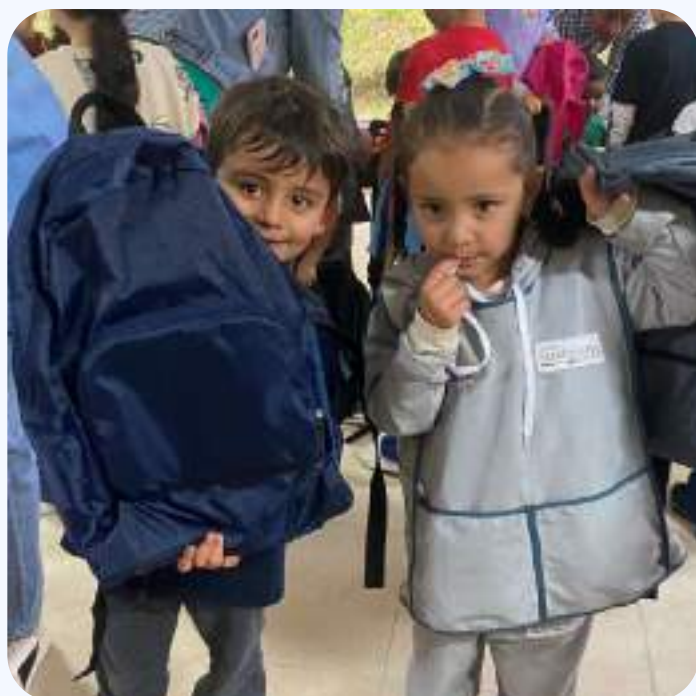
Donación CDI de Las Palmas

Queremos transformar vidas desde la educación a través de nuestros programas de becas: JKS, para acceso y permanencia en educación superior y ConnectI, acceso al programa de robótica de The Columbus School.