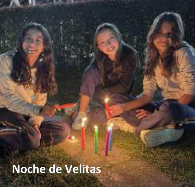
Noche de Velitas