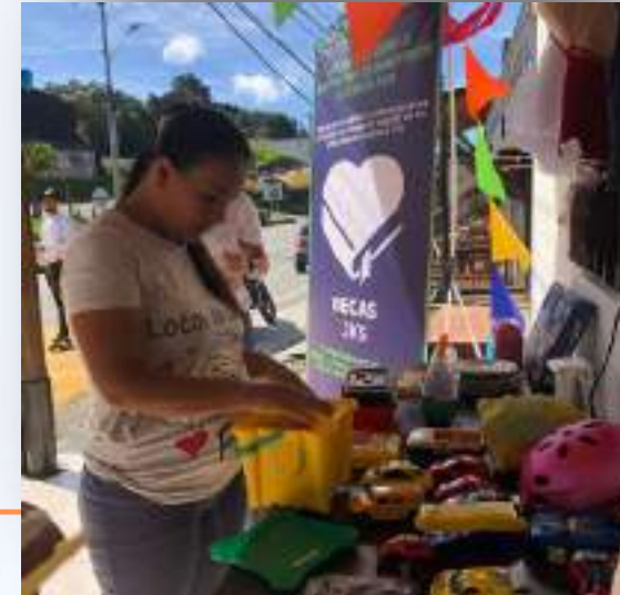
Habitante de la vereda Las Palmas en el ropero externo

Alianza con Tronex que permitirá a los estudiantes de Robótica TCS y el programa ConneCTI tener pasantías en su empresa.