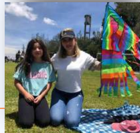
Festival de la Cometa