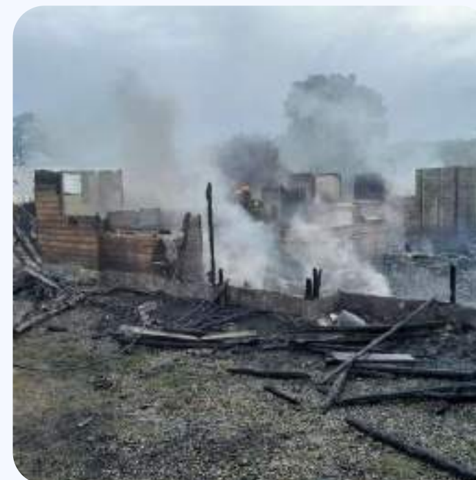
Incendio hogar familia TCS

Generamos impactos positivos en nuestra comunidad interna a través de escenarios que propicien la activación de líderes para servir. Esto lo logramos a través de nuestro programa de voluntariado y la activación del fondo solidario.