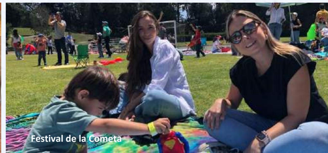
Festival de la Cometa