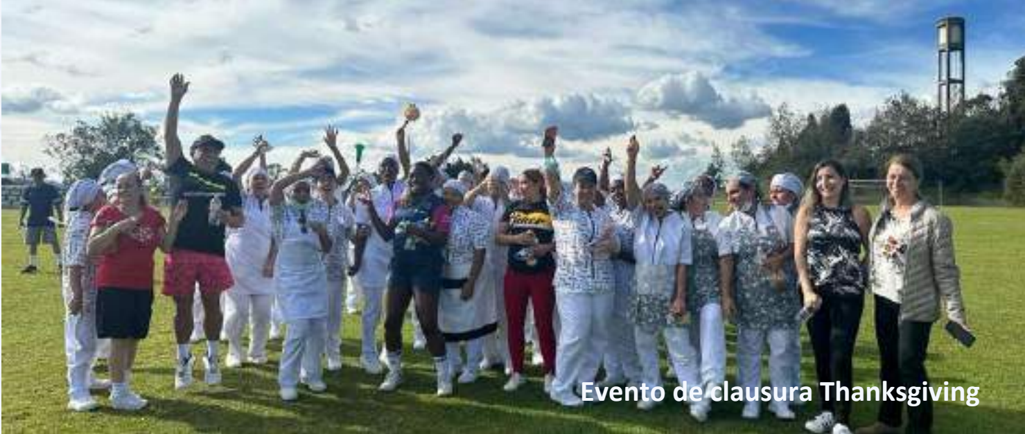
Evento de clausura Thanksgiving